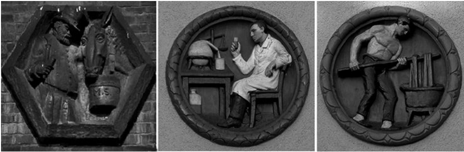
Fot. 3. Autor: Agata Gwizd-Leszczyńska

Figurative Flachreliefs bringen das Bild der Arbeit näher. Sie beziehen sich in ihrer Form auf die Antike und den preußischen Klassizismus und unter Verbindung der klassischen und romantischen Tradition stellen sie Arbeiter dar: ihre Kraft, Unbeugsamkeit und Verbundenheit mit der Tradition. Einen nicht unbedeutenden rhetorischen Einfluss hat die Verwendung entsprechender Materialien – behauene Steinblöcke, Ziegel, Holz und verputzte Mauer. Die Verwendung einfacher Rohmaterialien betont die Bedeutung der Handwerker- und Zunftgemeinschaften sowie die Haltbarkeit natürlicher Rohstoffe. Die Erzeugung politischer Bedeutungen kommt in Details, Sockelornamentik, Wandverkleidung, stark hervorgehobenen Ecken, gebogenen Korridoren, die den Eindruck der Unendlichkeit und des repräsentativen Gebäudecharakters steigern, zum Ausdruck. In der Plastik wird die traditionelle Rollenverteilung in der glücklichen und gesunden Familie, der germanische Menschentyp, männliche Kraft, Geborgenheit und Stabilität und die körperliche und geistige Disziplin hervorgehoben. Schematische, depersonifizierte Gestalten der Arbeiter aller damaligen Wirtschaftszweige erlauben die Identifizierung und ermuntern, sich der Mitwirkung beim Schaffen einer neuen, starken Nation anzuschließen.