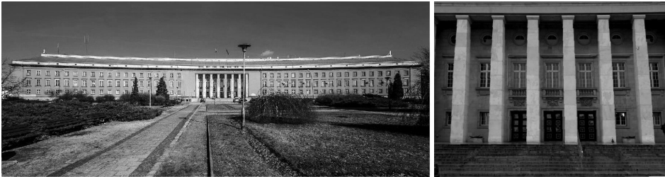
Fot. 1. Quelle: https://polska-org.pl/3713517,foto.html ; Fot. 2. Autor: Agata Gwizd-Leszczyńska

heutigen Woiwodschaftsamtes (Fot. 1 und 2), damals das neue Regierungspräsidium, mit mächtigen Pfeilern im Pfeilerportikus und der zum Eingang führenden Treppe, steigerten bewusst die ideologische Haltung.